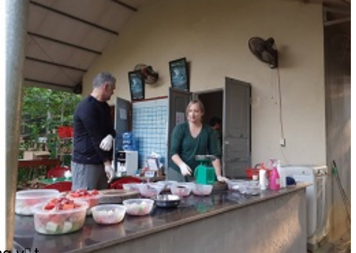
Các tình nguyện viên chuẩn bị thức ăn cho động vật