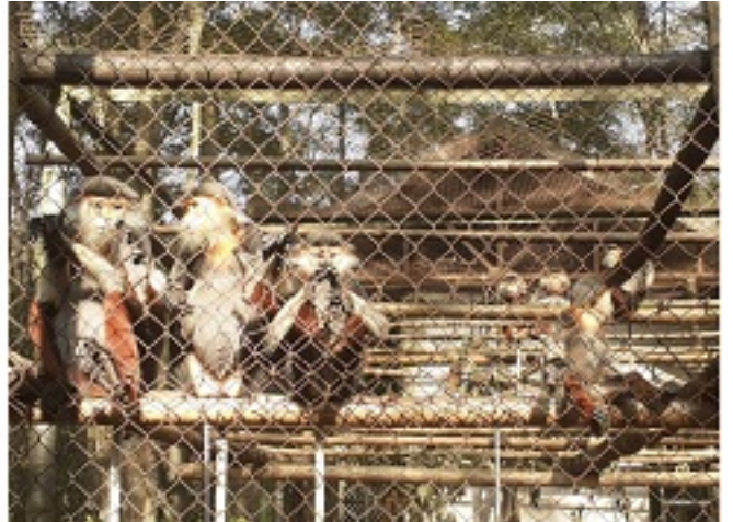
Nhiệm vụ bắt thú ăn cho Linh trưởng - Gia đình Vọc Chà và chôn cất được cứu hộ