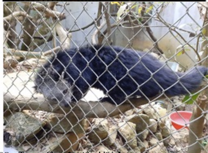
Con cầy mĩc này đĩc cứu hĩi tĩi Hội An nên đĩc Trung tâm đĩt tên Hội An