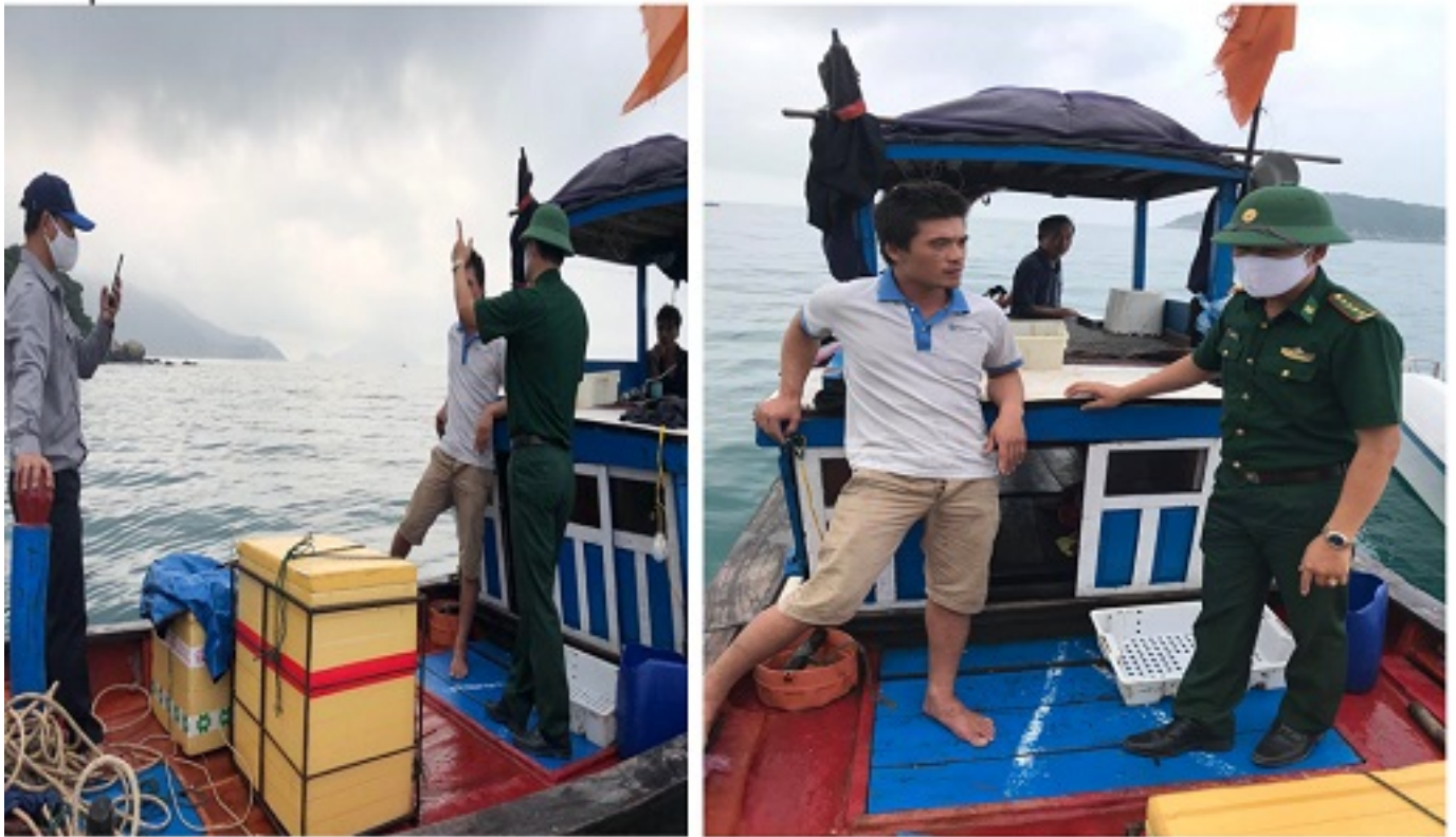
Hình 5 - 6: Lực lượng chức năng tuần tra kiểm soát và tuyên truyền phòng chống dịch Covid-19 tại Cù Lao Chàm.

Sau khi được tuyên truyền, các chủ phương tiện cam kết thực hiện nghiêm các quy định của Khu bảo tồn và khai thác thủy sản đúng pháp luật đồng thời tuân thủ nghiêm các biện pháp phòng chống dịch bệnh. Theo qui định bổ sung, trong thời gian phòng chống dịch bệnh Covid-19, lực lượng chức năng tạm giữ tất cả các giấy tờ có liên quan cho đến khi các phương tiện rời khỏi vùng biển Cù Lao Chàm./.