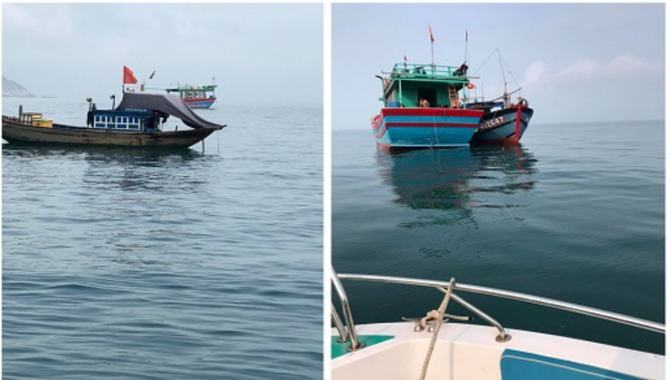
Hình 3 - 4: Các phương tiện khai thác thủy sản của các phương tiện khác đã được tuyên truyền và phòng chống dịch Covid-19 tại vùng biển Cù Lao Chàm.

Trong chuyến tuần tra ngày 20/3/2020, lực lượng tuần tra đã tiếp cận 12 phương tiện khai thác trên biển của các phương tiện khác đang neo đậu tại vùng biển Cù Lao Chàm. Các phương tiện chủ yếu là thuyền của huyện Núi Thành (04 phương tiện), ngành nghề chèo, pha xúc của Duy Xuyên (06 phương tiện). Theo đó, lực lượng chức năng đã kiểm tra thực tế hành chính; hướng dẫn, tuyên truyền thông các quy định về khai thác thủy sản sai quy định - bất hợp pháp tại vùng biển Cù Lao Chàm; đặc biệt quản trị các chủ phương tiện và thuyền viên thực hiện nghiêm các quy định và hướng dẫn của UBND xã Tân Hiệp về các biện pháp đảm bảo an toàn cho người dân xã đó trong mùa dịch Covid-19, chính yếu là nghiêm cấm giao dịch, buôn bán, tiếp xúc với người dân địa phương trong mùa dịch.