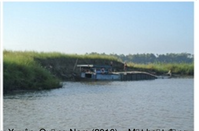
Đình Từ Khá, Quận Ngũ Hành Sơn, Đà Nẵng (2016) – Một hoạt động