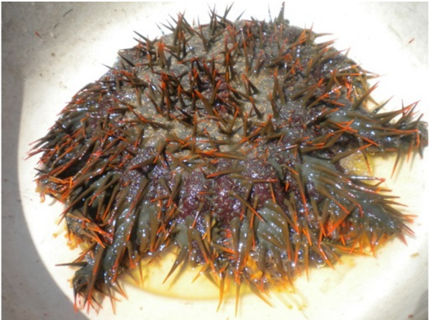
Hình 2: Sao biển gai ( Acanthaster planci )

Sao biển gai thường sinh sống nhiều trong điều kiện nhiệt đới nóng ẩm (Mùa xuân-hè). Trong mùa sinh sống này, con cái sẽ phát tán trứng ra môi trường nước và trứng có thể lên đến 60 triệu trứng. ấu trùng Sao biển gai trôi nổi trong vòng hai đến bốn tuần, trước khi lắng xuống các rạn san hô và phát triển thành một tập thể hoàn chỉnh và ăn thịt trên san hô. Sau 06 tháng, Sao biển gai bắt đầu ăn polyp san hô.