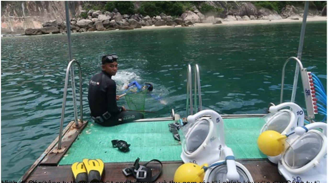
Hình 4: Các công ty tham gia chiến dịch chống rác thải nhựa và thu gom rác tại chính khu vực của Công ty