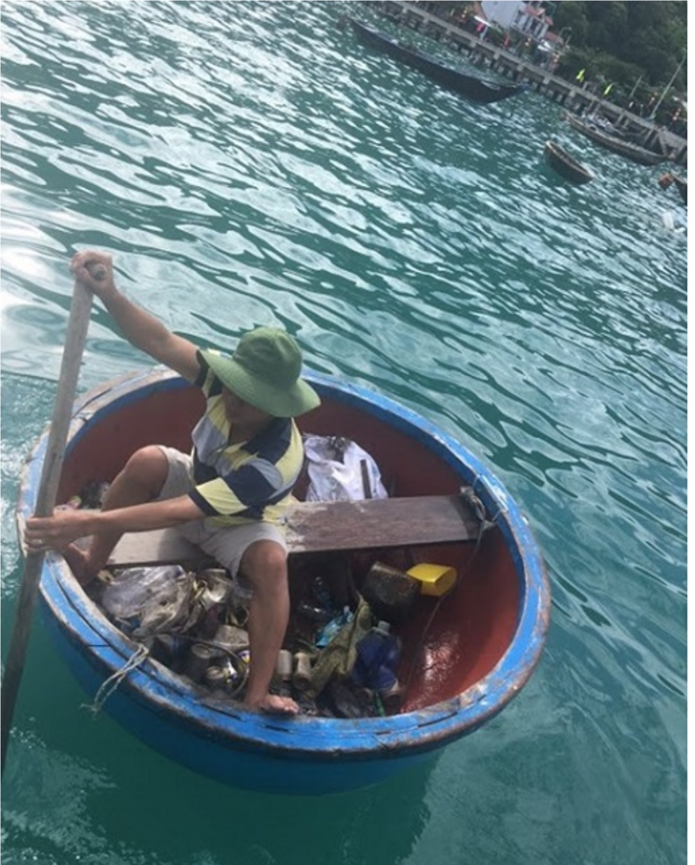
Chiến dịch ch bắt sao biển gai và thu gom rác trên các rạn san hô trong Khu bảo tồn biển Cù Lao Chàm