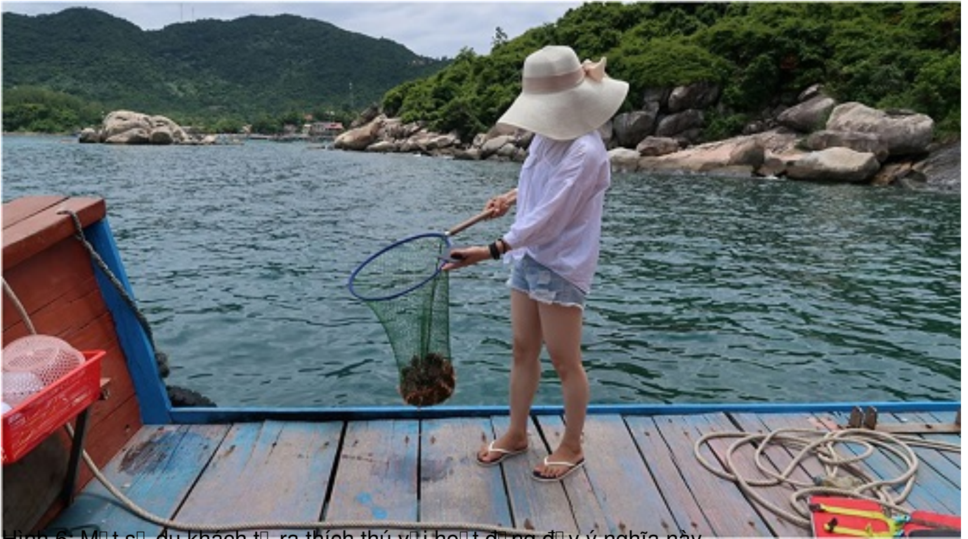
Hình 6. Một số du khách tỏ ra thích thú với hoạt động đi vớt nhãi này