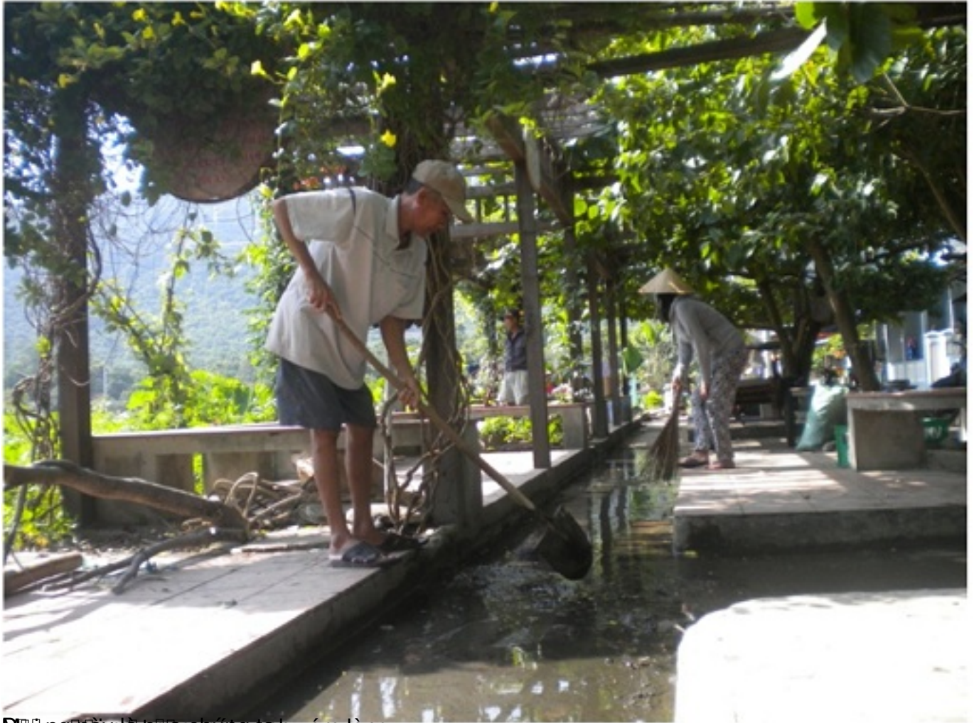
Mọi người cùng nhau dọn dẹp vệ sinh chung quanh xóm làng