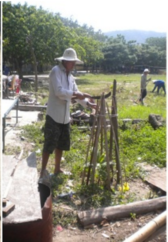
Trồng thêm cây xanh cho đẹp hơn thêm sạch