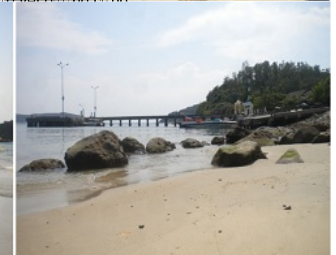
Nhà quản lý đã đi kiểm tra tình hình và đánh giá mức độ ô nhiễm để có biện pháp xử lý kịp thời.