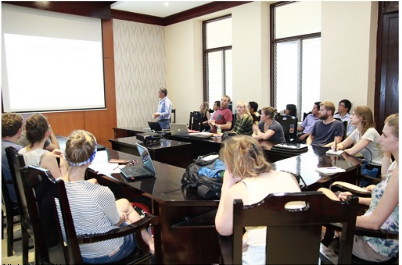
Hình 7: Hội lý thuyết