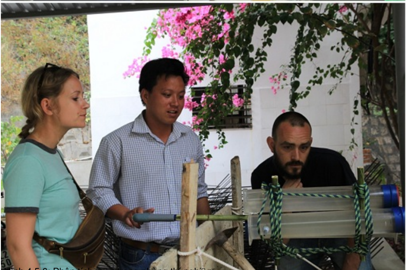
Hình 4,5,6: Phân tích mẫu ở phòng thí nghiệm