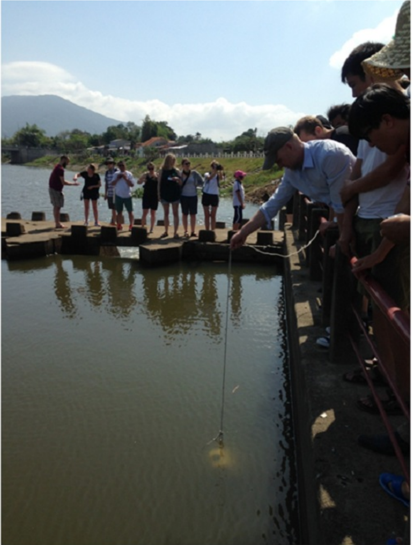
Hình 3: Đo hàm lượng chất rắn lơ lửng trong nước bằng Partcam