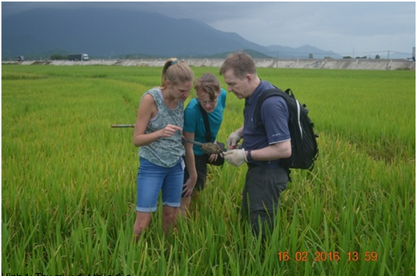
Hình 1: Thu mẫu đất thực địa