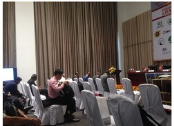
Bên cạnh Công ty Điện lực Hòa Bình, nhiều doanh nghiệp trong lĩnh vực quản lý và xây dựng thủy điện các