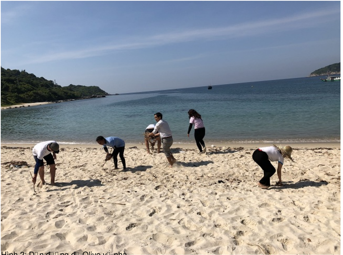
Hình 2: Dự án trồng Olive vũ nhà