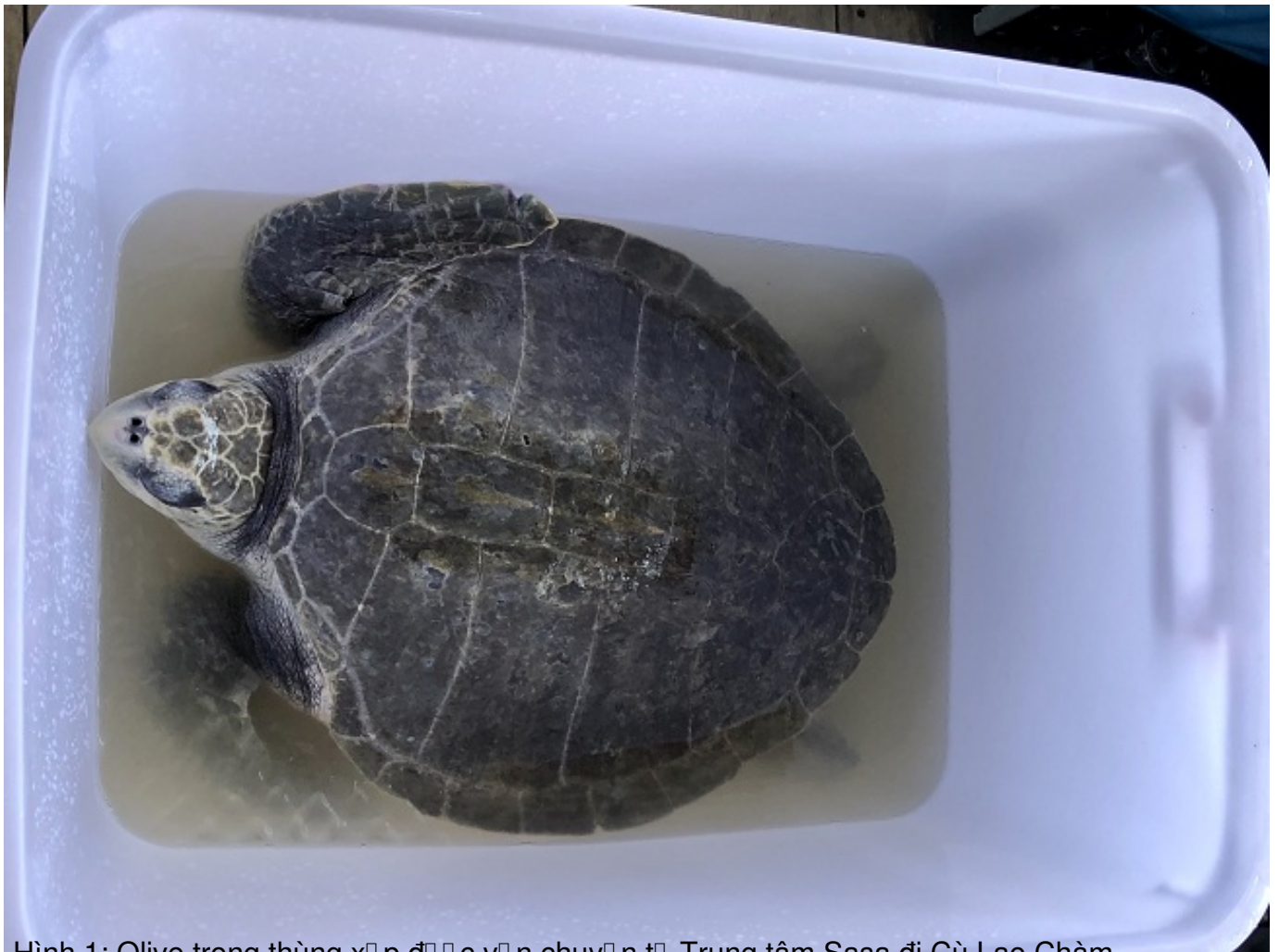
Hình 1: Olive trong thùng xốp để vận chuyển từ Trung tâm Sasa đi Cù Lao Chàm