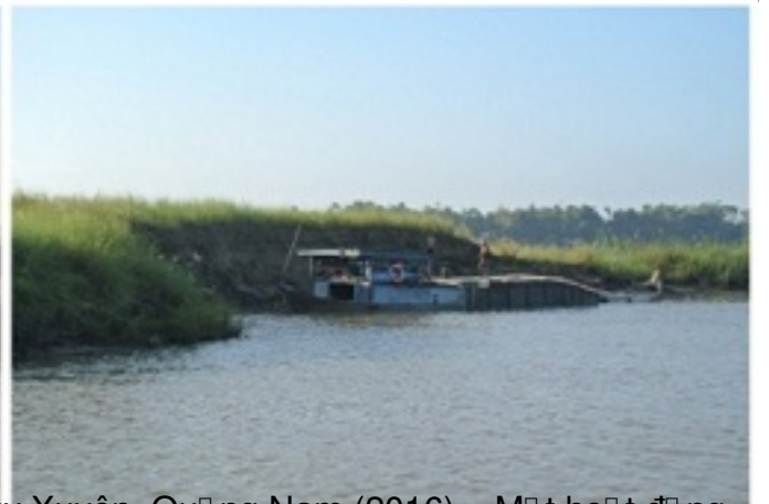
Đình T. K. Qu. Á. Nam. i. p. h. p. Duy Ph. c, Duy Xuyên, Qu. ng Nam (2016) – M. t. h. t. đ. ng