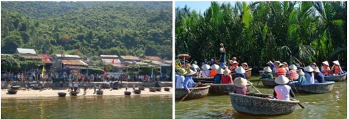
Hình 1: Du khách gia tăng trải nghiệm tại vùng sinh thái Cẩm Thanh và quần thể Cù Lao Chàm.

Hiện nay, có 3 trung tâm phát triển du lịch nằm trong phạm vi Khu sinh quyển bao gồm Phố cổ Hội An (thuộc vùng chuyên đề), Rừng dừa nước hồ lớn sông Thu Bồn (thuộc vùng đề) và quần thể Cù Lao Chàm (thuộc vùng lõi) đều đang có xu hướng gia tăng số lượng du khách hàng năm. Trong bối cảnh khu sinh quyển chưa có được giải pháp tốt trong việc đáp ứng nhu cầu của du khách thì sự gia tăng này chính là một tác động rất lớn, đặc biệt là các khu vực có các hệ sinh thái rất nhạy cảm với tác động của con người như rừng san hô, rừng dừa nước, các thảm cỏ biển, các bãi biển. Điều này không những ảnh hưởng đến các hệ sinh thái mà còn làm suy giảm nghiêm trọng tài nguyên đa dạng sinh học trong các hệ sinh thái này.