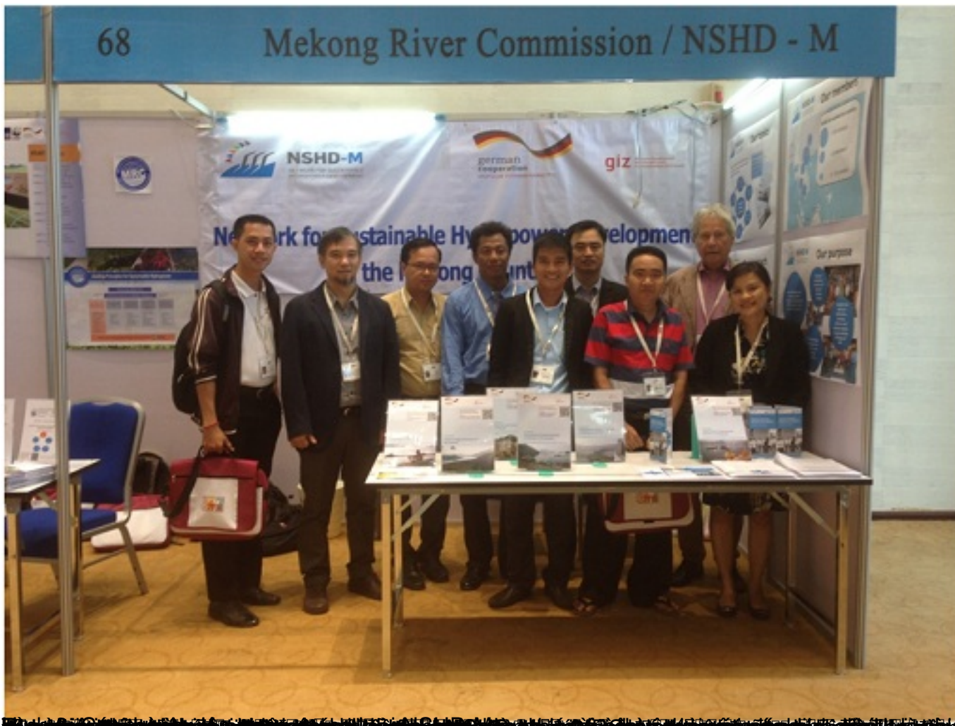
8/11/2016 10:31 AM